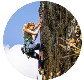
Sports & Leisure