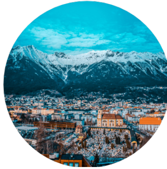
Alpine life quality