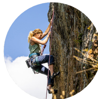
Bergsport & Freizeit