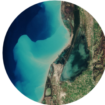
Erdbeobachtungsprodukte und Informationsservices für die Umweltbeobachtung